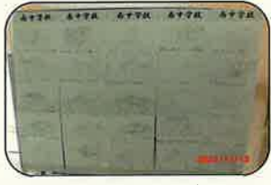
↑ 南中学校生徒作品