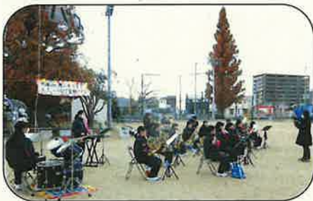
南中吹奏楽部の演奏

また7月にかるがもクラブ実行委員会が企画し、金栄小児童が作成した「希望の樹」の電飾もツリーの横にトンネル状に点灯され、1月7日までの期間、校区を照らし続けます。