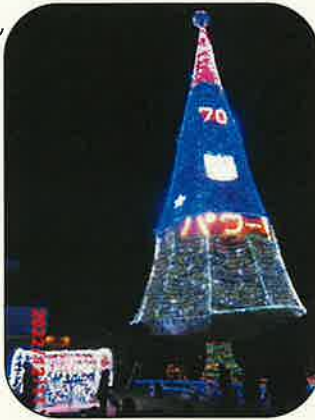
点灯したドリームツリー