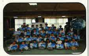
8/30 高専とコラボ（気象の話）